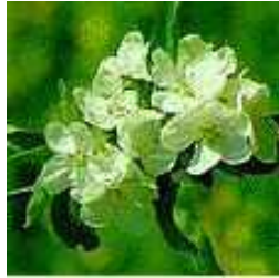
市の花「リンゴの花」